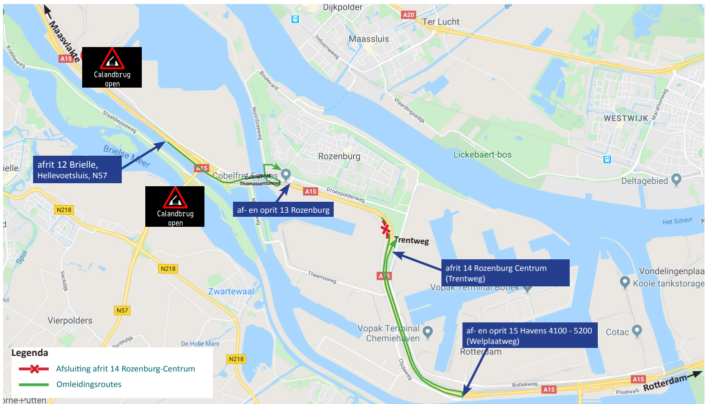
Afbeelding 3 Afsluiting afrit 14 Rozenburg-Centrum van A15 richting Rotterdam van vrijdag 25 maart 21:00 uur tot maandag 4 juli 05:00 uur

Via www.blankenburgverbinding.nl/webinar22maart kunt u zich aanmelden. U ontvangt dan een link waarmee u de uitzending kunt bekijken. Het webinar kunt u later via onze website ook terugkijken.