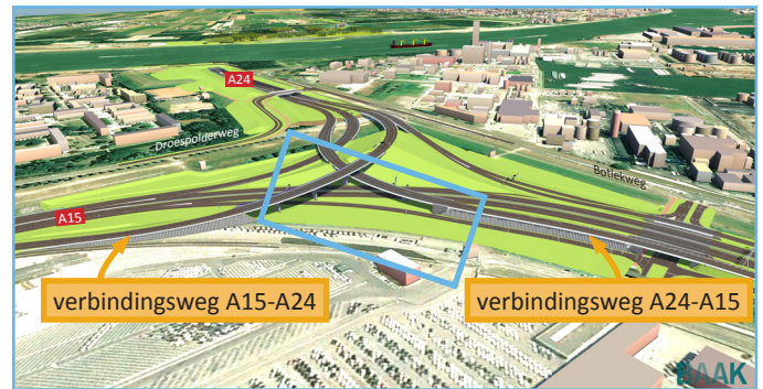
Afbeelding 1 Ontwerp knooppunt Rozenburg