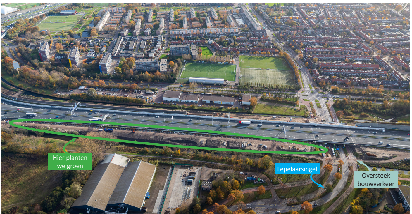
Afbeelding 2 Locatie aanplant groen langs A20 en oversteek bouwverkeer

Om de panelen van het geluidsscherm veilig te kunnen monteren, zijn er afsluitingen nodig op de A20 en de Lepelaarsingel. Dit mag alleen als er minder verkeer rijdt. Daarom doen we dit in de avond en nacht van maandag 31 januari tot en met donderdag 3 februari tussen 20:00 uur en 05:00 uur.