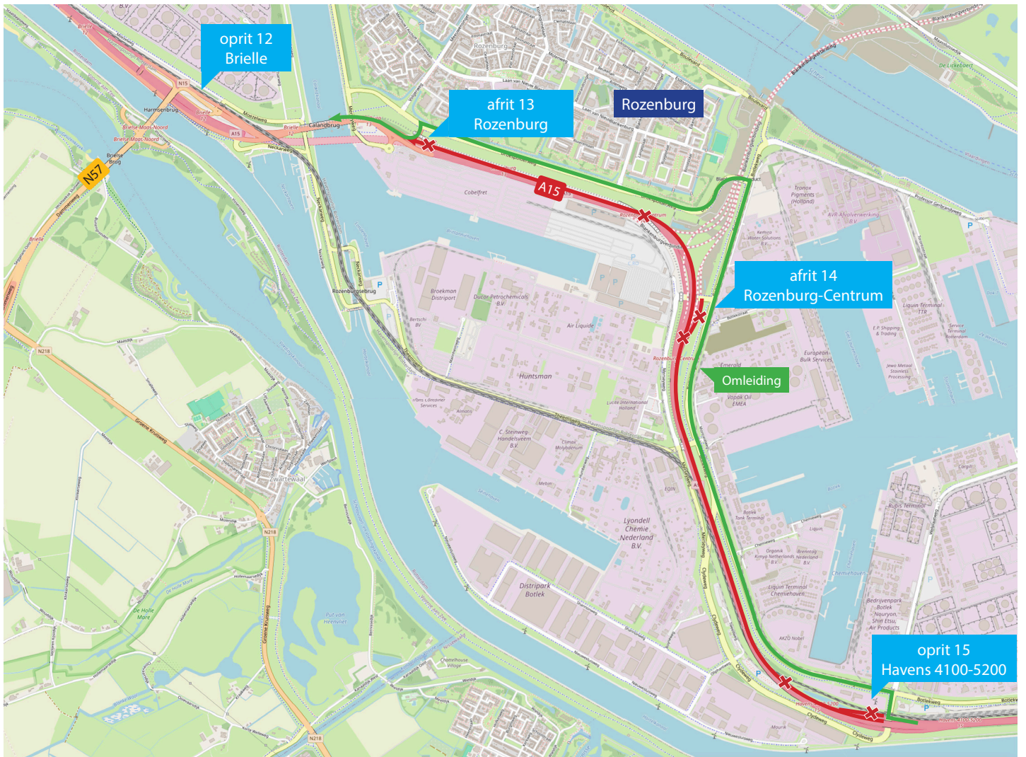
Afbeelding 2 Nachtafsluitingen A15 richting Maasvlakte op vrijdag 15, zaterdag 16 en zondag 17 maart en omleidingsroute. Op de rijbaan richting Rotterdam is 1 rijstrook beschikbaar.

BAAK legt in opdracht van Rijkswaterstaat de Blankenburgverbinding aan. De nieuwe weg verbindt de A15 en de A20 tussen Rozenburg en Vlaardingen en verbetert de bereikbaarheid van de bedrijven in het Rotterdamse havengebied en in Greenport Westland.