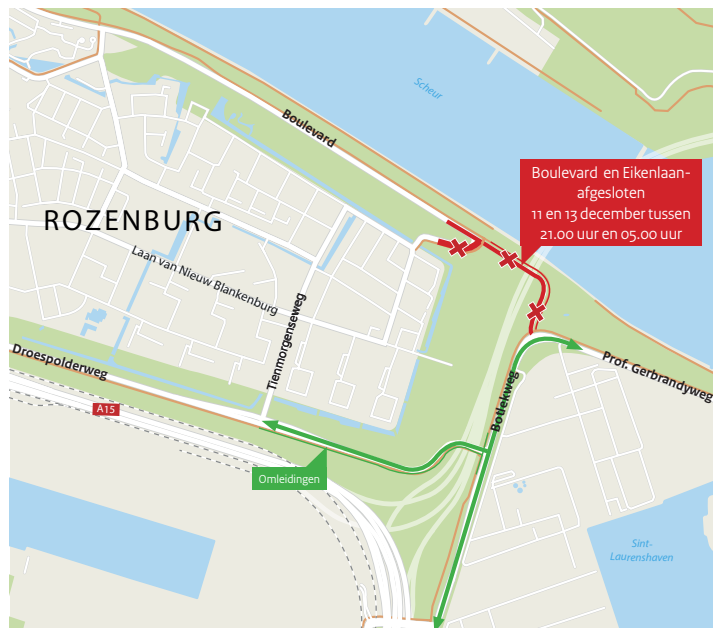
Afbeelding 2 Afsluiting Boulevard voor al het verkeer op 11 en 13 december en omleidingsroutes

We werken deze vijf dagen tussen 21.00 uur en 05.00 uur. De verschillende werkzaamheden zorgen voor geluid in de omgeving. Dit kan hinderlijk zijn voor omwonenden.