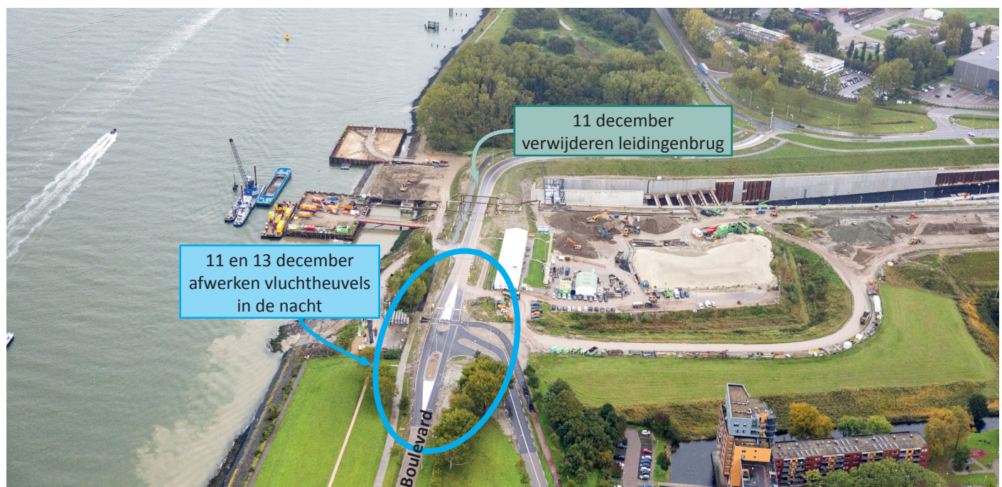
Afbeelding 1 werklocaties bij Boulevard en Eikenlaan 11 en 13 december tussen 21.00 uur en 05.00 uur

Op vrijdag 15 december schilderen we de vluchtheuvel op de Droespolderweg nabij de kruising Droespolderweg/Botlekweg.