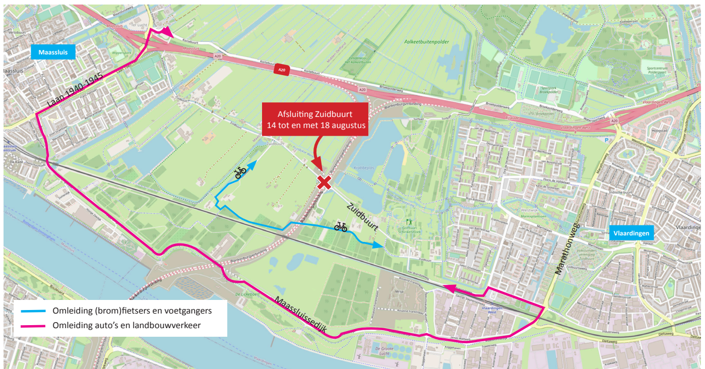
Afbeelding 2 Afsluiting Zuidbuurt, omleidingsroutes en bereikbaarheid woningen en bedrijven

Met de brandweer, politie en ambulance hebben we afspraken gemaakt over de bereikbaarheid ook de huisvuilophalddienst is op de hoogte van de afsluiting.