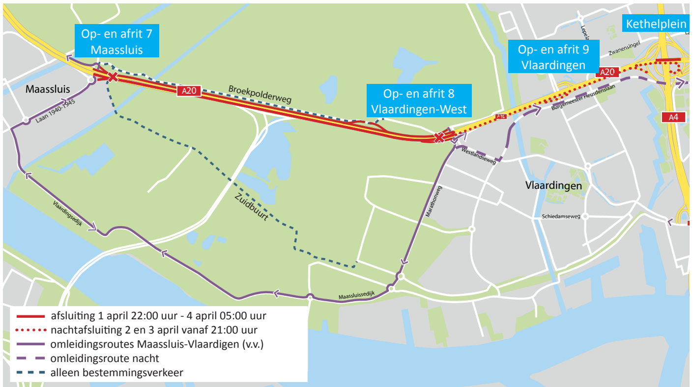
Afbeelding 4 Afsluiting A20 van vrijdag 1 april 22:00 uur tot maandag 4 april 05:00 uur (opritten vanaf 21:00 uur) en lokale omleidingsroutes

BAAK legt in opdracht van Rijkswaterstaat de Blankenburgverbinding aan. De nieuwe weg verbindt de A15 en de A20 tussen Rozenburg en Vlaardingen en verbetert de bereikbaarheid van de bedrijven in het Rotterdamse havengebied en in Greenport Westland.