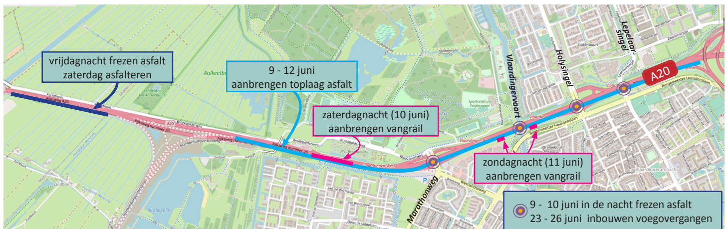
Afbeelding 1 Werklocaties A20 tussen Maassluis en Kethelplein 9 - 12 en 23 - 26 juni