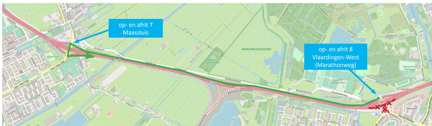
Afbeelding 3 Afsluiting kruising Marathonweg/Westlandseweg en af- en oprit van A20 richting Rotterdam en omléidingroutes vanuit Broekpolder (auto's)

De werkzaamheden aan de Marathonweg zijn ook opgenomen in de Van Dijk Projecten App. Deze app is gratis beschikbaar voor zowel iOS als Android en ook te gebruiken op een PC. Via de QR-code wordt u naar de downloadpagina geleid. Geen QR-scanner? De directe link naar de App is: https://app.vdijk.nl/marathonweg