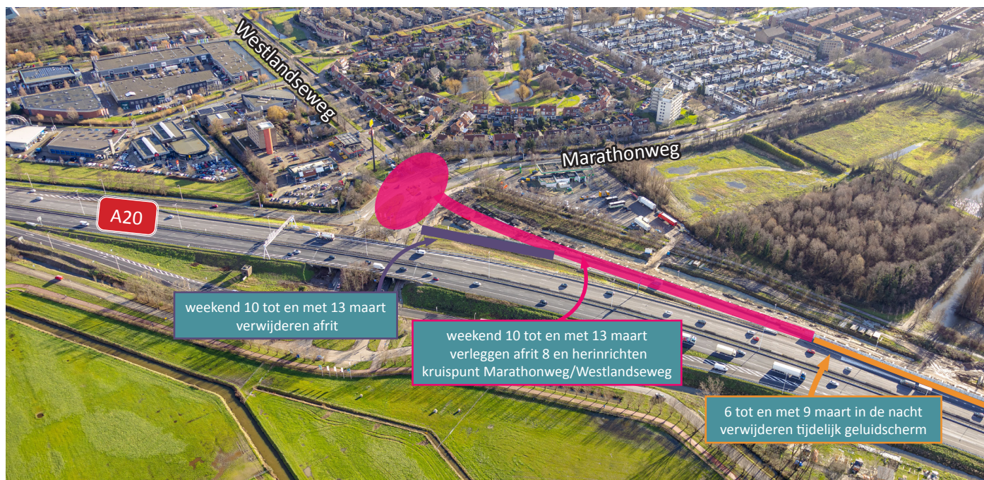
Afbeelding 1 Locatie weekendwerkzaamheden kruising Marathonweg/Westlandseweg en afrit 8

Verkeer wordt omgeleid via af- en oprit 9 Vlaardingen (Holysingel) en kan via de rijbaan richting Hoek van Holland terugrijden naar afrit 8 Vlaardingen-West. Op woensdag 8 maart wordt verkeer omgeleid via de Holysingel, de Burg. Heusdenslaan en de Billitonlaan (v.v.).