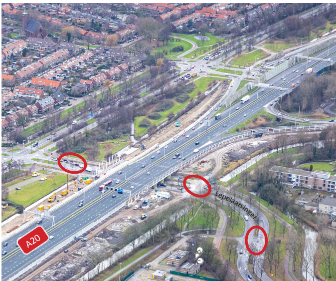
Afbeelding 1 Locaties werkzaamheden Lepelaarsingel

In de nacht van 2 op 3 mei passen we de weg aan zodat het verkeer weer aan beide kanten onder het viaduct doorrijdt. Tot en met 10 mei is de weg nog wel versmald, in beide rijrichtingen is 1 rijstrook beschikbaar. We herstellen dan de middenberm (zie locaties afbeelding 1) en schilderen de nieuwe pijlers van het viaduct in dezelfde kleur als de bestaande pijlers. Op 10 mei aan het eind van de middag zijn de werkzaamheden klaar en zijn in beide richtingen weer twee rijstroken beschikbaar.