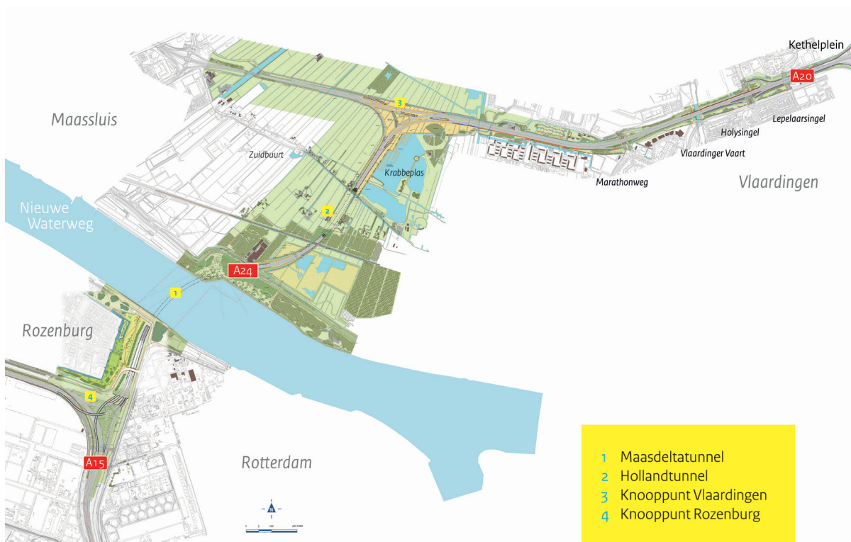
Afbeelding 1 Tracé Blankenburgverbinding

Als de kruising gereed is, bouwen we het laatste deel van de werkweg tot aan de Hoekse Lijn. Begin oktober is de bouwweg klaar en