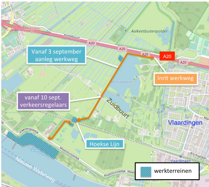
Afbeelding 2 Routes werkverkeer vanaf 3 september

wordt deze gebruikt voor de aanvoer van materieel en materialen voor de bouw van de Blankenburgverbinding. Het werkverkeer rijdt vanaf de A20 de werkweg op en rijdt dus niet via de Zuidbuurt. De werkweg wordt afgesloten met bouwhekken.