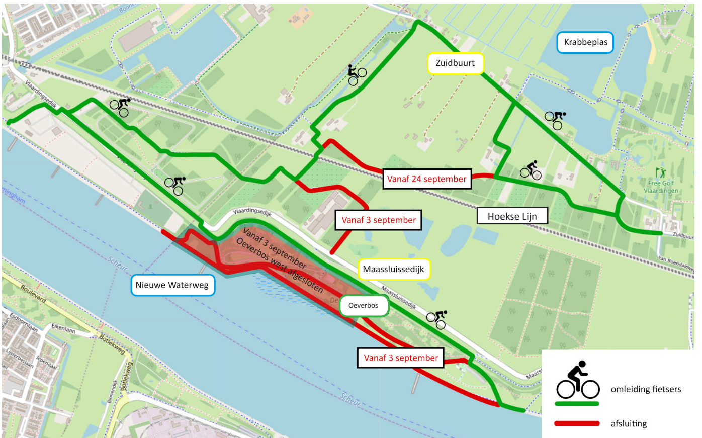
Afbeelding 3 Afsluitingen fietspaden en Oeverbos west vanaf september