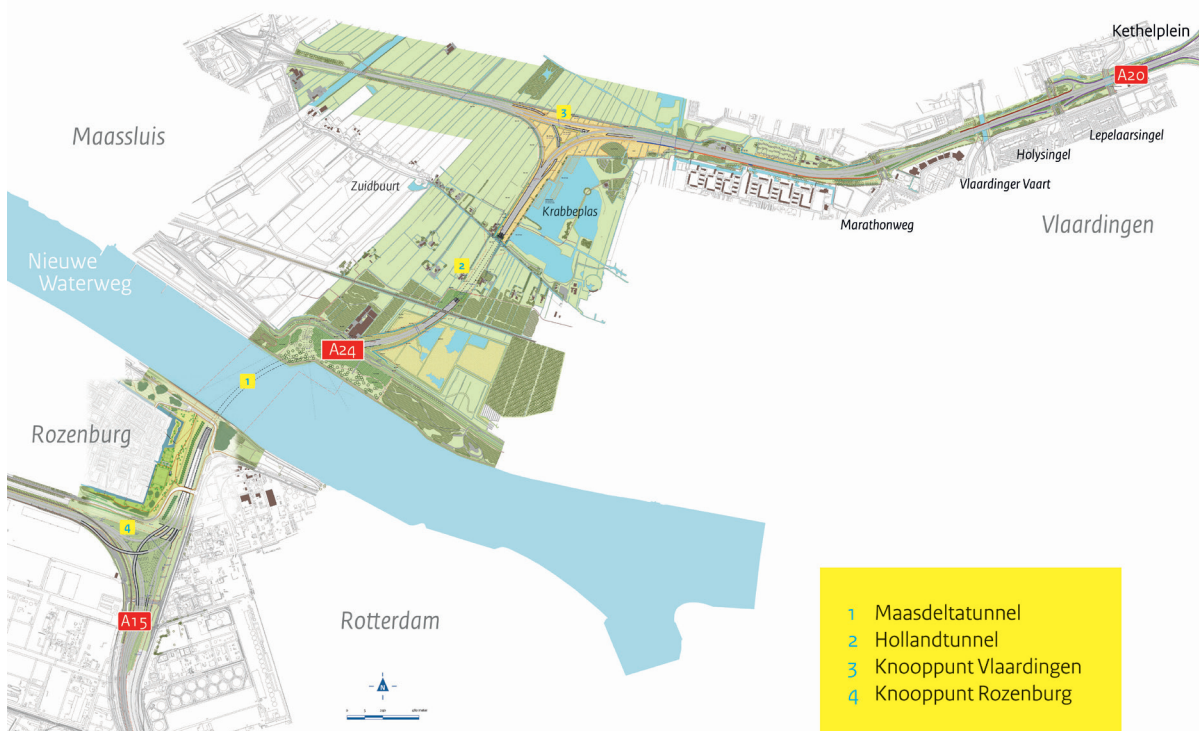
Afbeelding 1 Tracé Blankenburgverbinding

BAAK richt werkterreinen in bij de Hoekse Lijn en bij de A20. Ook het westelijk deel van het Oeverbos wordt ingericht als bouwterrein (zie afbeelding 2). Dit gedeelte van het Oeverbos is tijdens de bouw niet toegankelijk voor het publiek. Het werkgebied en de werkterreinen worden afgesloten met bouwhekken.