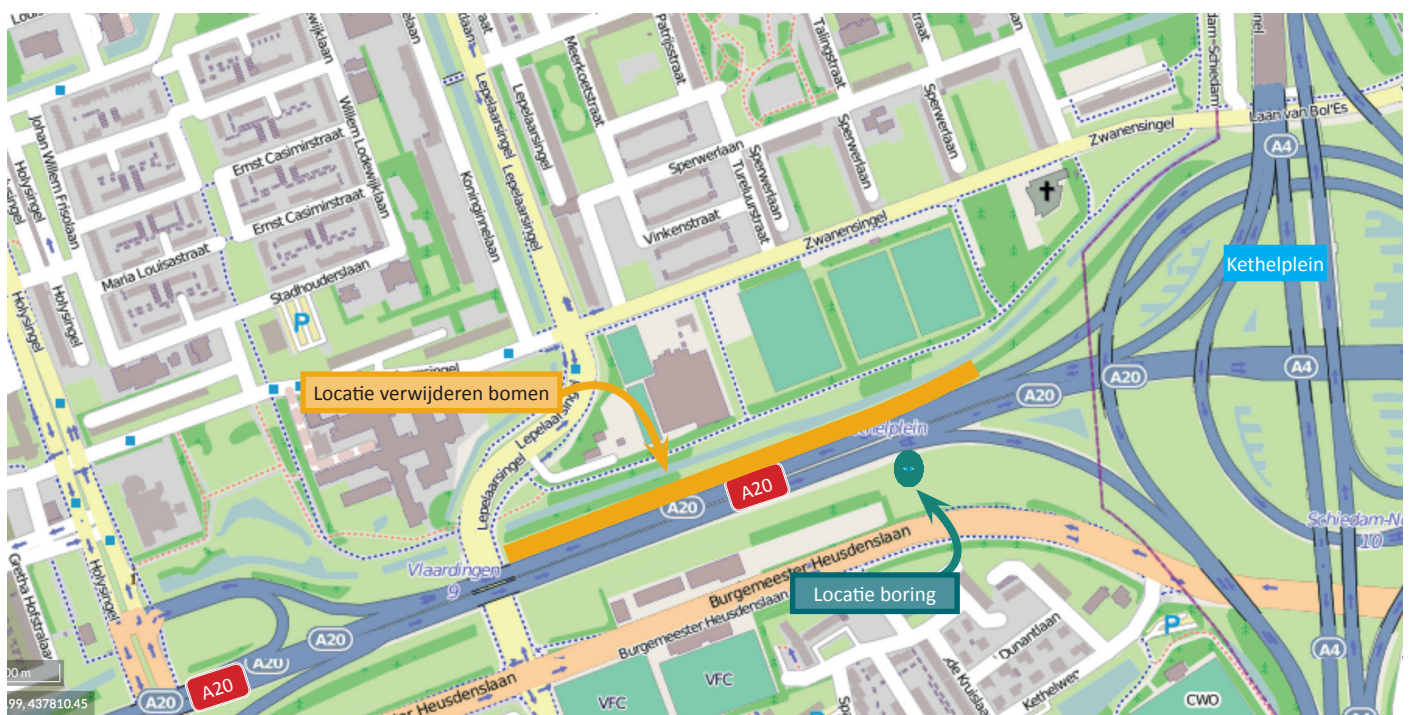
Afbeelding 1 Locatie werkzaamheden op 22 en 23 februari tussen 21:00 en 05:00 uur.

Verkeer wordt omgeleid naar de A20 richting Rotterdam en kan bij af- en oprit 11 Schiedam keren en via de A20 terugrijden naar het Kethelplein. Hier kan het verkeer doorrijden richting Hoek van Holland of afslaan naar de A4 richting Delft. Verkeer voor Den Haag wordt omgeleid via de A20 en de A13. Op afbeelding 2 staan de afsluitingen aangegeven.