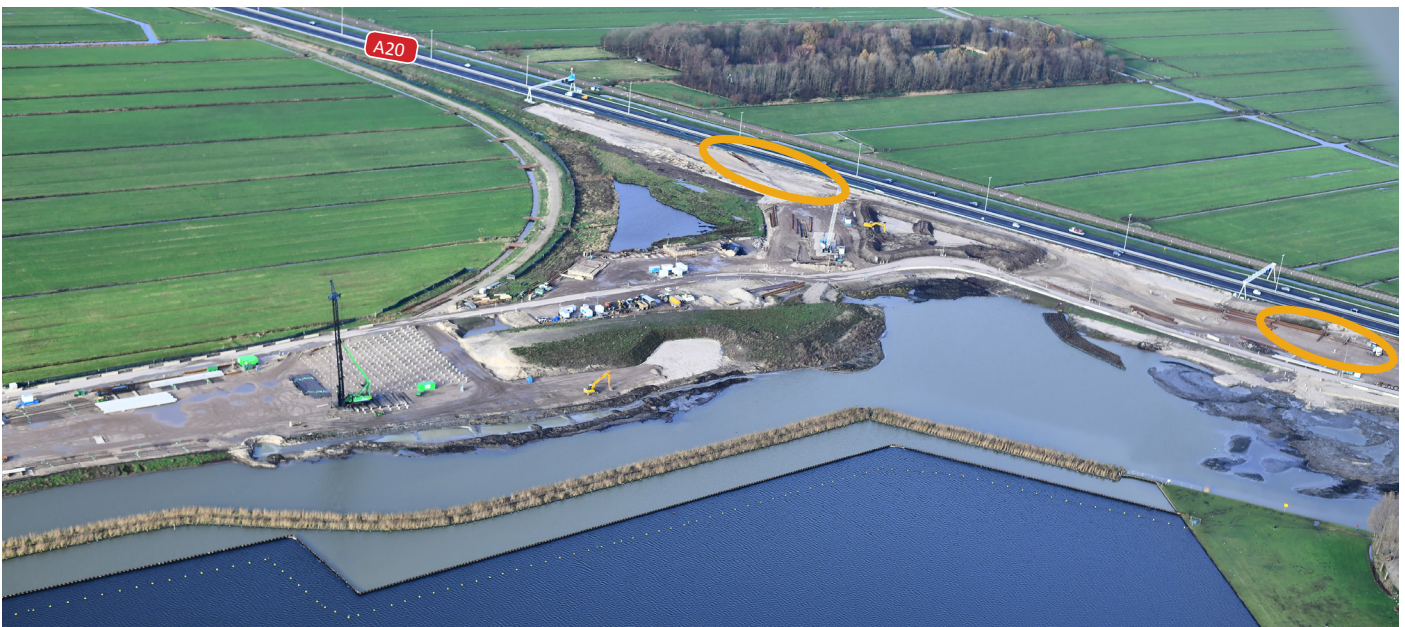
Afbeelding 2 Locatie weekendwerkzaamheden knooppunt Vlaardingen

BAAK legt in opdracht van Rijkswaterstaat de Blankenburgverbinding aan. De nieuwe weg verbindt de A15 en de A20 tussen Rozenburg en Vlaardingen en verbetert de bereikbaarheid van de bedrijven in het Rotterdamse havengebied en in Greenport Westland.